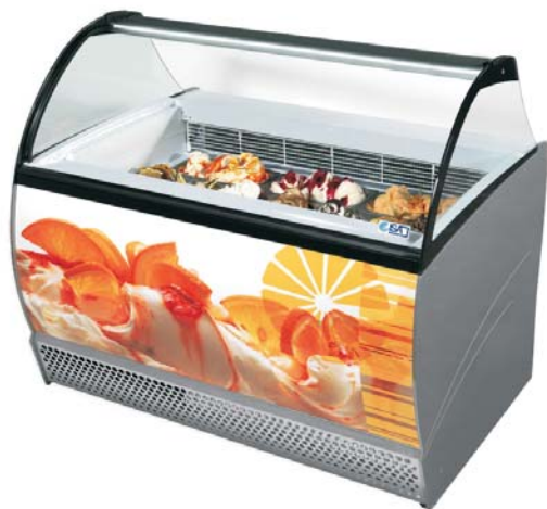
ISABELLA LX 10